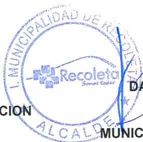
DANIEL JADUE JADUE ALCALDE MUNICIPALIDAD DE RECOLETA